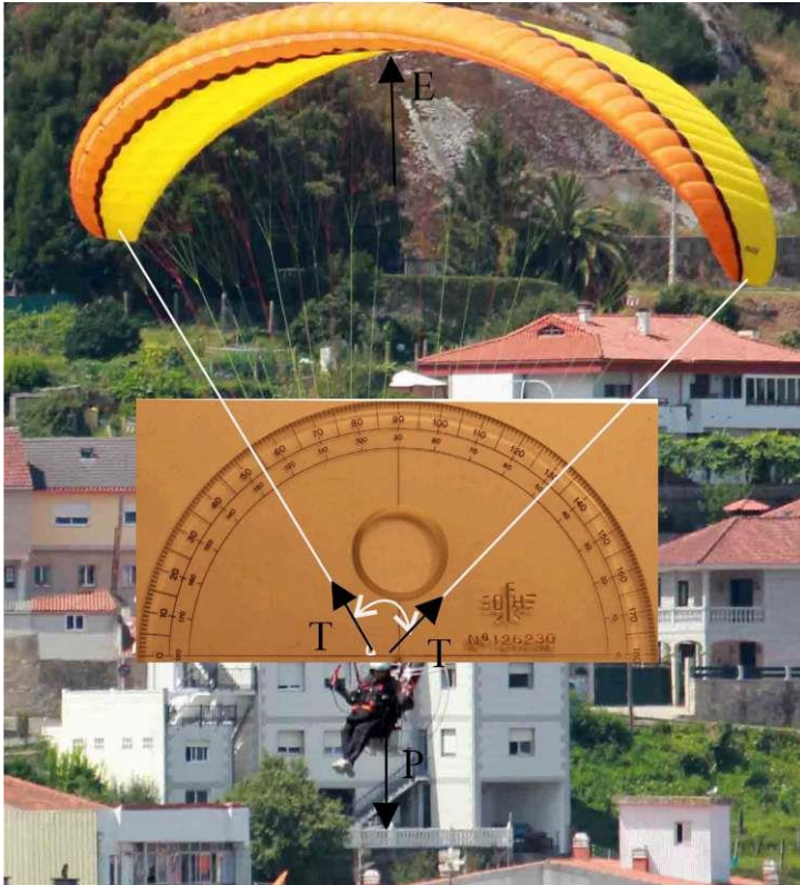
Fuerzas en los sistemas

Se pueden suponer dos sistemas en equilibrio, el superior, en el cual el empuje aerostático del parapente deberá equilibrarse con las tensiones de los cables que lo unen al otro sistema deportista, motor –impulsor.