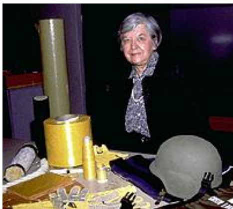
Stephanie Kwolek , inventos y aplicaciones