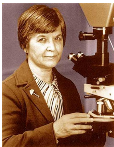
Stephanie Kwolek en 1973

Kwolek fue galardonada en 1996 con la medalla nacional de Tecnología e Innovación “por su contribución a la investigación, desarrollo y procesamiento de cristal líquido de las fibras de aramida de alto rendimiento que ofrecen nuevos productos en todo el mundo para salvar vidas y beneficiar a la humanidad”. Recibiendo el premio de manos del presidente de Estados Unidos.