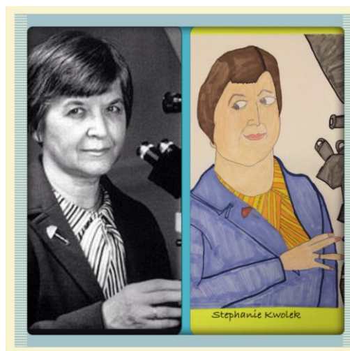
Stephanie Kwolek y su caricatura infantil