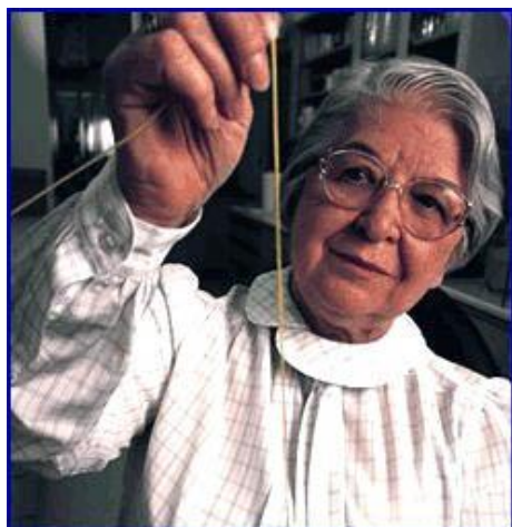
Stephanie Kwolek con una fibra de kevlar