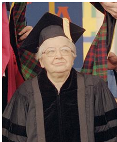
Stephanie Kwolek en 2001, al recibir el título honorífico de su universidad

Stephanie Kwolek falleció a los 90 años, el 18 de junio de 2014, en el hospital de Wilmington, después de una breve enfermedad 10 .