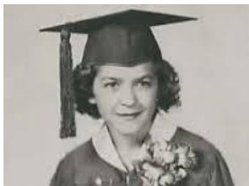
Stephanie Kwolek en su graduación

No recibió un Nobel, ni una cátedra; eligió la empresa, La Dupont, de polímeros ( la misma que creó el nylon) y a través de ella, creo el kevlar, la fibra que por su ligereza y dureza, constituyó los chalecos antibalas de militares y policías.