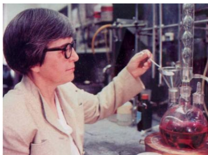
Stephanie Kwolek en su laboratorio I