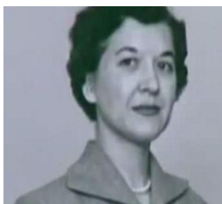
Stephanie Kwolek en sus comienzos en la DuPont

Nació en New Kensington, Pensilvania el 31 de julio de 1923. De familia polaca, su padre que murió cuando tenía 10 años, le inculcó su pasión por la naturaleza. Su madre tuvo que hacerse cargo del sostenimiento de la familia, dedicándose a la costura. Consiguió graduarse en química en la universidad para mujeres de Carnegie Mellon, a los 23 años.