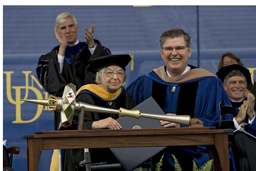
Stephanie Kwolek en 2001, recibiendo el título de Doctor Honoris causa