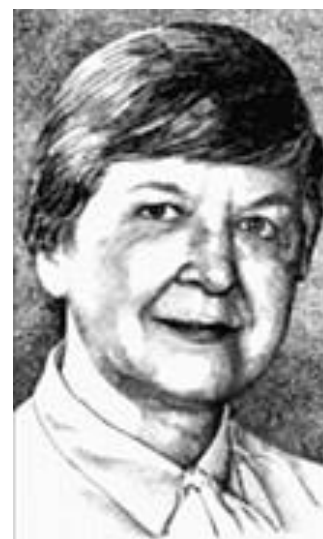
Dibujo de Stephanie Kwolek

Ya en 1976 había recibido la medalla Potts, por el descubrimiento del kevlar. Fue la cuarta mujer incluida en el portal de la fama, para inventores en 1994 9 . Tres años después lo sería en el salón de la fama de los plásticos.. Premio de la Sociedad Americana de Química de la invención creativa. Medalla Perkin en 1997.