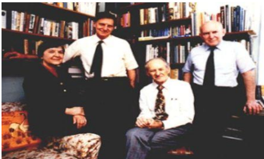
Equipo que descubrió el kevlar en 1965

Como económicamente no podía realizar estudios superiores 1 , comenzó a trabajar en la empresa DuPont en Buffalo 2 , dedicada a la química industrial, especialmente polímeros, siendo promovida cuatro años después a la sección de fibras industriales de esa misma empresa en Wilmington 3 .