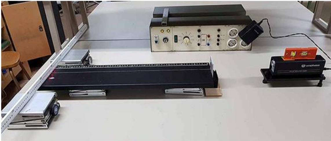
Fotografía 1.- Montaje real de un experimento. La regla hace de pantalla y sobre ella aparecen las manchas luminosas procedentes de un láser de He-Ne después de atravesar la red de difracción.